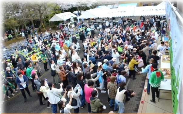
お菓子まきでにぎわうステージ前

最後の締めは恒例のお菓子まき。あの景色を見ると祭りが終わる寂しさ、準備していた様子とを思い出しながら、また来年皆様にご一緒の楽しみと様々な気持ちにさせてくれます。ゆめふる成田が開設し初めのお祭りで保護者の方への負担やバスでの移動後降りてからの動き等不安もありましたが、流石ゆめふる成田を支える職員です。連携をとりながら開催時間に合わせ到着。ついでに好きな屋台に向かっ行って行く姿はとても印象的でした。それはまた1年後に！